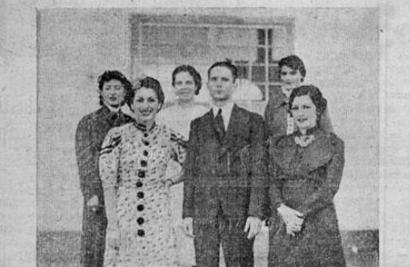
LA GRAFICA recoge a un grupo de bachilleres del colegio de San Luis Gonzaga que contribuyeron activamente a la organización de la fiesta de los graduados de ese prestigioso centro de educación secon-